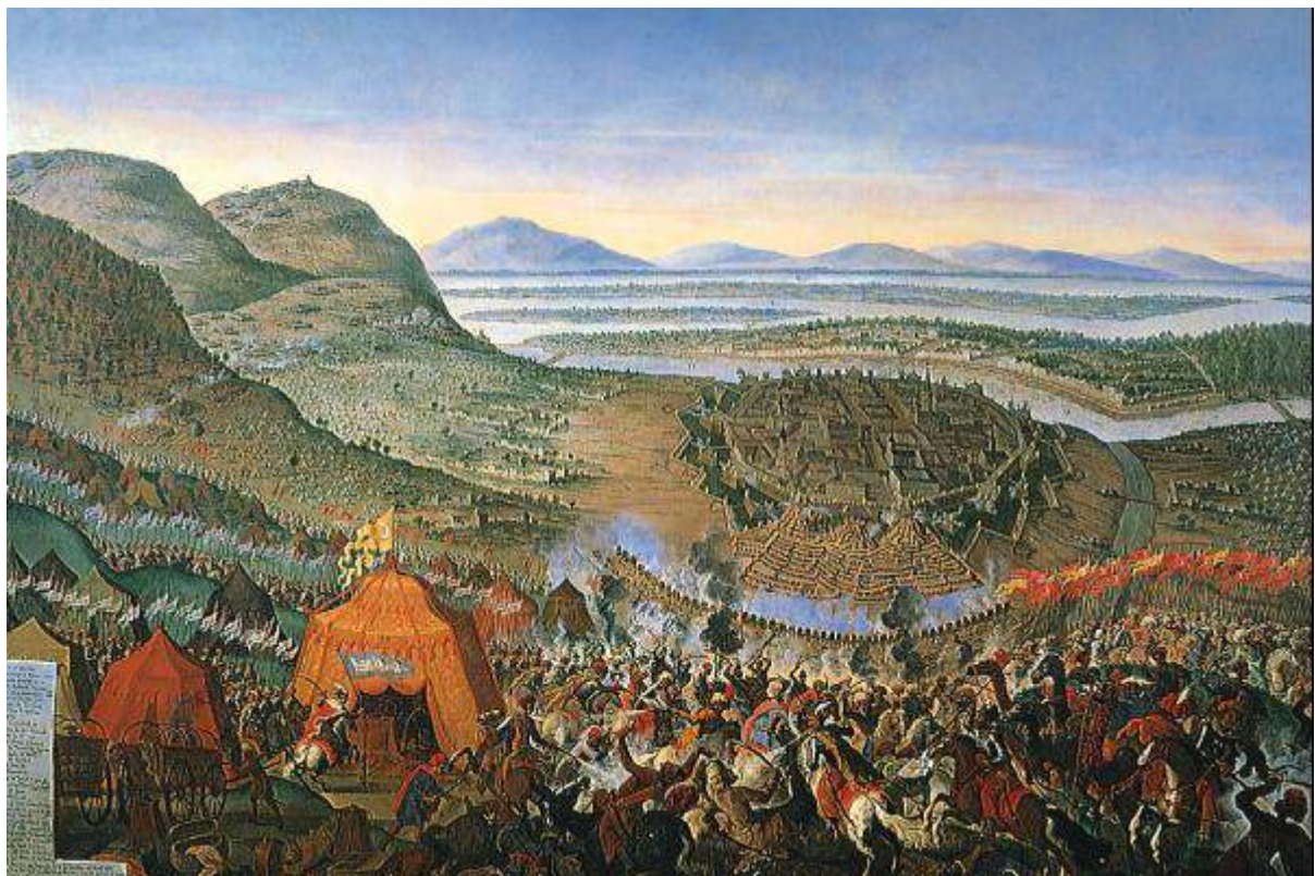
Schlacht am Kahlenberg

Insbesondere die polnischen Elitesoldaten, die berittenen "geflügelten Husaren", stürzten die Türken ins Chaos und spornten sie zu läuferischen Höchstleistungen an. Erst zehn Kilometer weiter gelang es den jämmerlichen Resten der Türken, sich zu sammeln und die Flucht halbwegs geordnet fortzusetzen. Das Einfallstor nach Europa war den islamischen Eroberern für die nächsten Jahrhunderte versperrt.