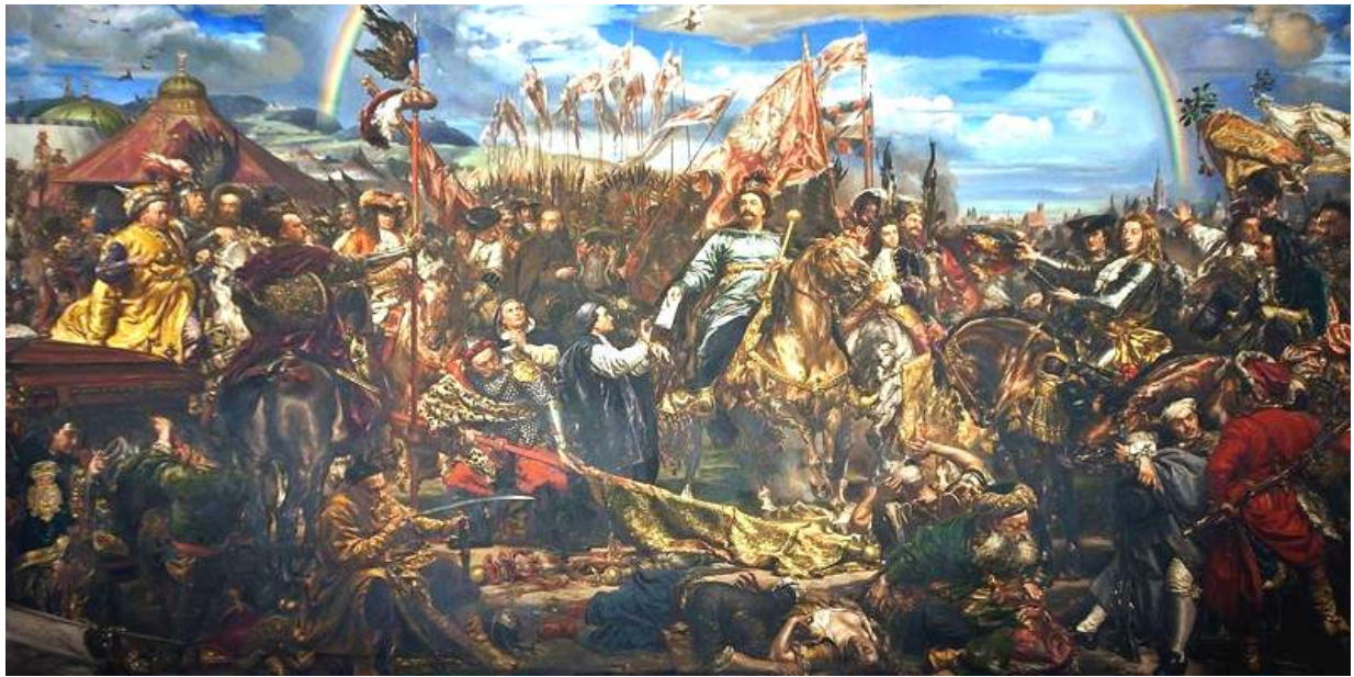
Jan Matejko 1880