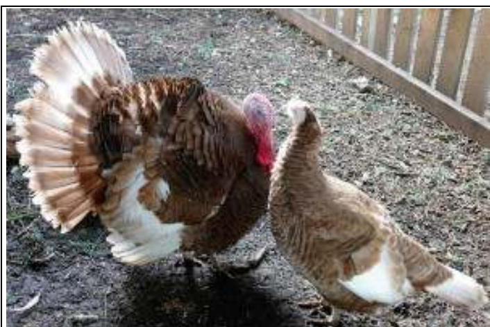
Das Bild zeigt die Prachtentfaltung des türkischen Puters (turkey = Puter) vor einer dummen Pute

Die Türkei darf auch kein NATO-Partner bleiben, weil sie die Interessen der NATO hintertreibt, indem sie dem IS hilft, seine Ölverkäufe abzuwickeln. Und viele Stimmen sehen es als außenpolitisch fatal an, der Türkei so ein gewaltiges Erpressungspotential einzuräumen. Wenn die Beitrittsverhandlungen mit der EU stocken, braucht die Türkei nur wieder neue Flüchtlinge durchzulassen, und schon geht es weiter.