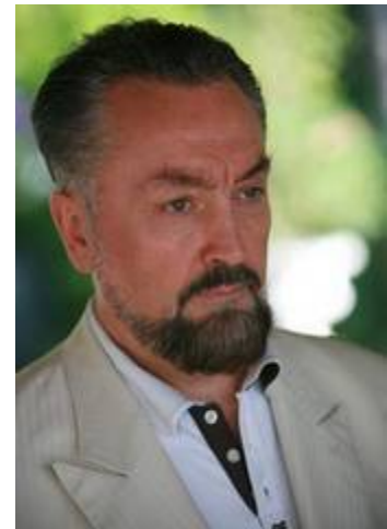
Abgrundtiefer Hass gegen Darwins Theorie: Harun Yahya

Hinter der Charmeoffensive steckt der abgrundtiefe Hass von Yahya und seinen muslimischen Fundamentalisten auf die Lehre von Darwin. Diese besagt, dass sich die Lebewesen durch genetische Veränderungen über Jahrtausende entwickelt haben. Somit widerlegt die Evolutionstheorie die Schöpfungslehre, wie sie Bibel und Koran postulieren. Im Kampf gegen Atheismus und Materialismus ist dem in der muslimischen Welt sehr bekannten Hardliner selbst eine Allianz mit christlichen Hardlinern willkommen.